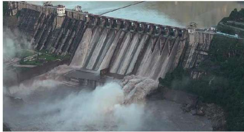
Earliest project: A view of the Salal Dam on the Chenab river in Jammu and Kashmir.

The project was first accorded an environmental clearance by a designated committee in 2017, when it