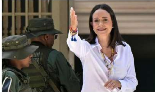
María Corina Machado is a 'key, unifying figure' in the once deeply divided Opposition to President Nicolas Maduro's government.

Reacting to the honour, Ms. Machado said she was