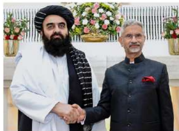
Reaching out: S. Jaishankar with Afghanistan's Foreign Minister Amir Khan Muttaqi in New Delhi on Friday.

Mr. Jaishankar noted that India and Afghanistan share a "common commitment towards growth and